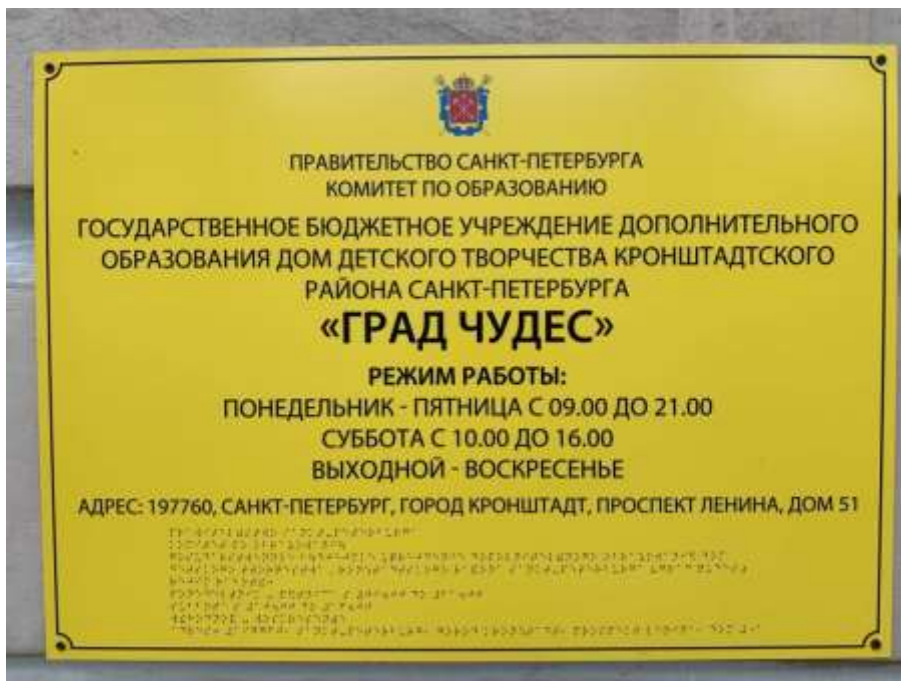
Вывеска учреждения с дублированием шрифтом Брайля

для маломобильных групп населения на 01.01.2020 года