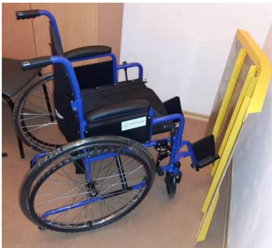
Инвалидная коляска универсальная H035 ТМ «Армед» и пороговый пандус