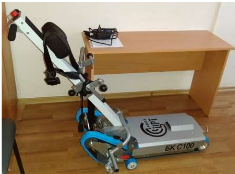
Подъёмник лестничный гусеничный БК С100